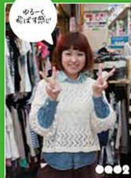
ゆきー 隠れ家的服屋 リのん

加藤茶本舗のチャーターです。 このコーナーも2回目ですね。早いかな。 今回和さんだサイズピースは、「せんばやし界隈のイカした男子と女子！」です。