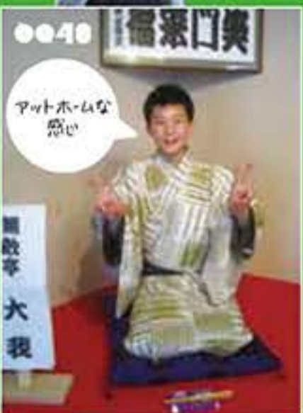
無敵亭大我 中学生