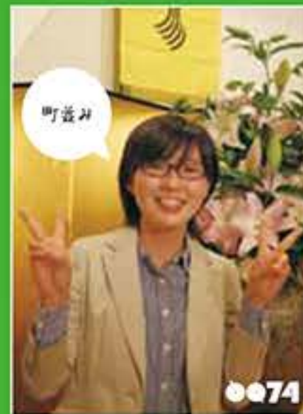
ゆーり まちづくりコーディネーター