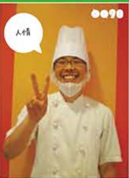
かねやん パン工房 巻の屋