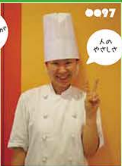
リサコ パン工房 巻の屋