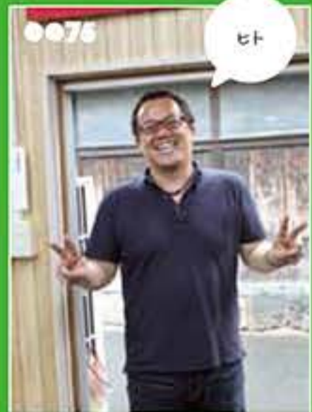
ギョーシャ イベント