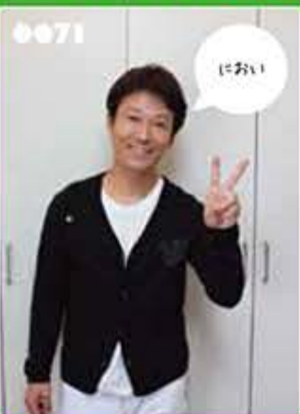
ショッカー しおかわ整骨院・千林大宮商店街理事長