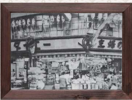
【昭和33年頃】 主婦の店『ダイエー一号店』。