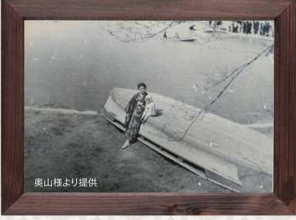
【年代不明】 淀川の岸边にて。後ろには平太の渡しが見えます。

第二回千林昭和写真展へ千人の方にこれまで場いただき、誠にありがとうございました。今回は『昭和振りつづ』のコーナーを作り、ご家庭に眠っているお宝写真を集めて展示しました。戦争へ出征される様子から高度成長期のエネルギーあふれる風景など、たった一枚の写真だけ力があるんですね。当時のご自身