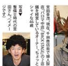
せんばやし秘話 こっそり あそび Vol.14 文芸春秋「おもしろい」

スで書き上げられた作品は、集中力と迫力の結晶でした。書は、集中してコツコツ継続すれば上達するよ。白と黒のバランス、余白が美しい。そう語られるお姿に、先生の穏やかなお人柄と書に対する熱意が伝わってきました。35年以上師事されているお弟子さんは「先生は誉めて育てる名人」とのこと。