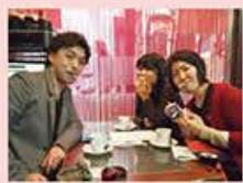
せんばやし秘話 こっそり あそび Vol.11 たばこ屋さんの事務所をお借りしての取材。ココアシガレットをたばこに見立てて記念撮影!

1000ピースプロジェクトとは 千林界隈の暮らしをもっと楽しくするプロジェクト。千林と、周辺の街全体をフィールドに活動しています。暮らしの中で見つけた魅力的な人、物、場所を取材して発信。さらに街の人と交流しながら新たな楽しさを作っていきます。 HP▶ http://1000ppj.jp Facebook▶ https://www.facebook.com/1000ppj