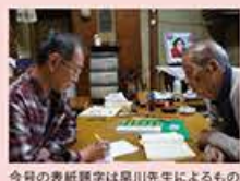
せんばやし秘話 こっそり あそび Vol.10 今号の表紙題字は早川先生によるもの。レポーターの「題字書いてください!」という凄腕なお願いを快く引き受けてくださいました。

最後に、集中力に欠けるレポーターへ向けて『喝』の書を頂きました。 (文)尾関守