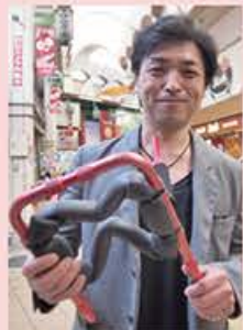
これが、『ある犬ねん』!