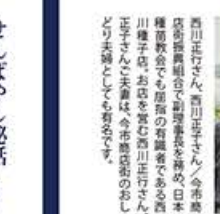
せんばやし秘話 こっそり あそび Vol.12 次号予告 12/20

せんばやし秘話 こっそり あそび Vol.12 きーつかいーの「ヘンタイ」 「顧客との距離が大事」そう言い切る姿は昔から変わらず、現在も店頭立ち声を出す。誰とも目を合わせずに「普段は無口で、人見知り、変わった人に見られがちな宮田幸茂さん。実は素晴らしい技術を持ち、よくしゃべり、素晴らしい技術を持ち、よくしゃべり、ここ千林で一番気遣いができる変態でした。彼は今日も進化し続ける...」 (文)木元信太郎