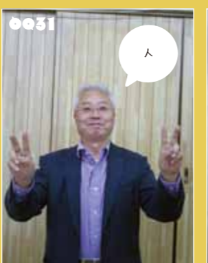
ノボチャン タンバ家具