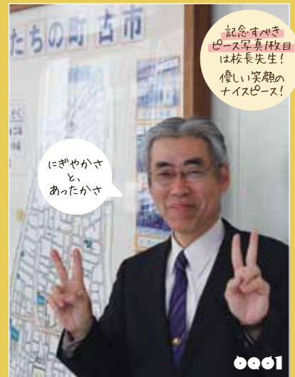
ヒデサン 古市小学校 校長先生

次号では「BIKE Works 回転馬」(ロードレーサー、マウンテンバイク専門店)を大特集します！乞うご期待！