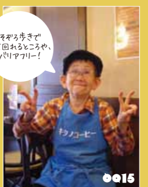
フーテンの虎太郎 キタノコーヒーマスター